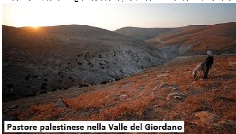
Pastore palestinese nella Valle del Giordano

Il 15 gennaio, il Ministro della Difesa israeliano, Naftali Bennett, ha approvato la creazione di sette nuove “riserve naturali” nella Cisgiordania occupata annunciando al contempo l'espansione di 12 “riserve naturali” già esistenti, tra cui il Parco Nazionale di Qumran, dove furono ritrovati i